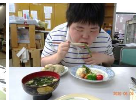
私たちも楽しんでますよー (ハハハ)