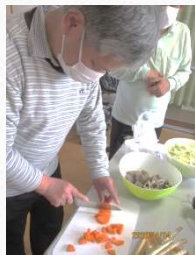
腕の見せどころです