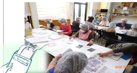
間違えないように・・・落ち着いて作業をします。