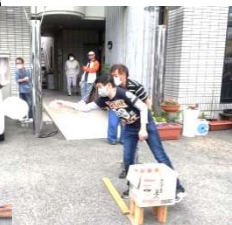
僕たちの美技をみよ!!