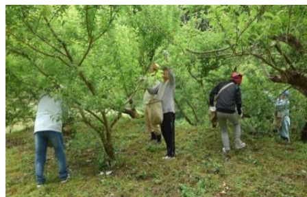
今年も綺麗な梅がなりました。

梅の収穫 砥部町七折産「ひかりの梅干し」として皆様にご愛用いただいている梅の収穫を、5月26日と29日の両日、利用者さんとボランティアさん・職員で行いました。七折の梅は糖度が高く品質の良い小梅として知られています。梅園の管理は、下草刈りを始め定期的なマイエンザの散布や鶏糞等の施肥、そして年末の剪定作業など、一年を通じて作業があります。農薬散布や化学肥料を使用せずに栽培していましたが、実の付きを心配していましたが、今年約200kgの収穫がありました。ホッとしているところです。 (支援員 三好)