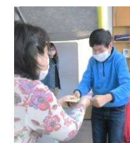
初めてのお給料に感激