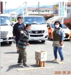
崩れなければ楽しいジェンガ