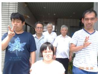
宜しくお願いします。