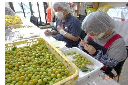
コツコツと丁寧に作業をします。